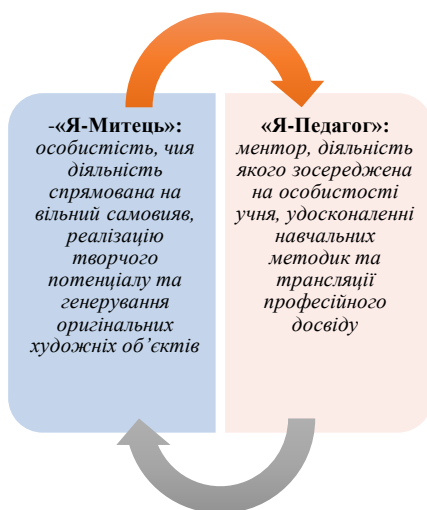
Рис. 1. Поєднання рольових моделей вчителя мистецьких дисциплін (укладено авторами)

- «Я – Педагог», яка характеризує наставника, зосередженого на особистості учня, методиці навчання та передачі професійного й творчого досвіду.