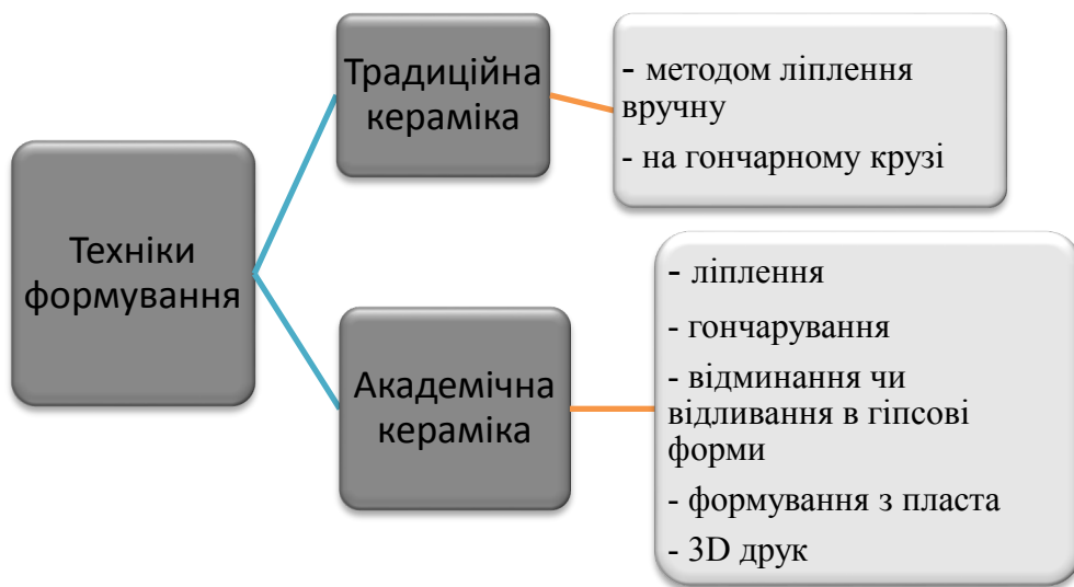
Рис. 2. Порівняння методів формування традиційної та академічної кераміки

Формування чи формоутворення як надання виробу форми може бути різним для традиційної та академічної декоративної кераміки (див. рис. 2).