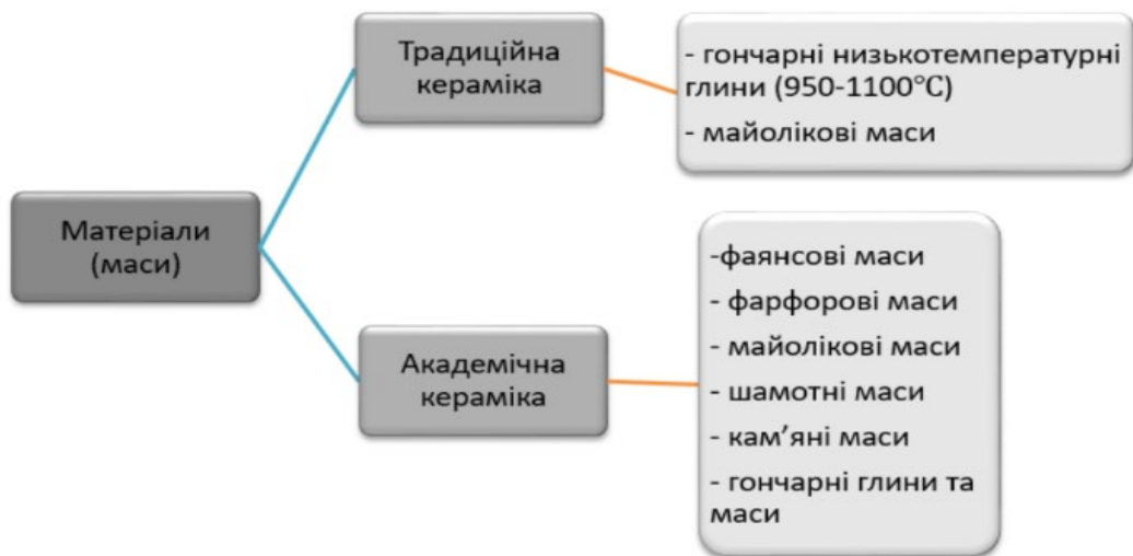
Рис. 4. Порівняння використання матеріалів (мас і глини) для виготовлення традиційної та академічної кераміки

Тобто, в академічній кераміці художник не обмежує свої можливості, він не зв'язаний традиційними методами декорування, а може робити все, що нафантазує. У традиційній кераміці митець має дотримуватися регіональних особливостей у методах декорування та формування.