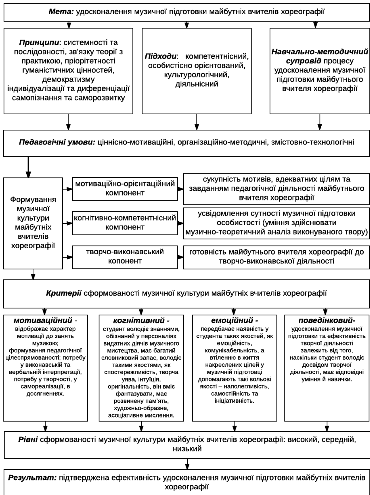
Рис. 1. Методика вдосконалення музичної підготовки майбутніх учителів хореографії

культури майбутніх учителів хореографії за допомогою обґрунтованих критеріїв, а зрештою – і результат.